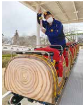
としまえんにあったミニサイクロンの車両が、仙台の八木山ベニーランドで運行開始! 多くのとしまえんファンが訪れました。(読者提供)