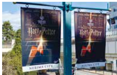
としまえんの跡地に6月16日オープンする「ワーナー ブラザース スタジオツアー東京 -メイキング・オブ・ハリー・ポッター」のフラッグ。(3月3日撮影 練馬駅前)