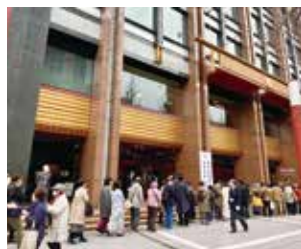
練馬区商業まつり 各商店会の歳末売出しで特賞を当てた方1,300名が観劇に招待されました。練馬文化センターが改修工事のため、明治座で開催。(3月21日)