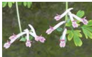
ジロボウエンゴサク