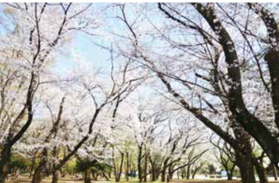
今年は桜の開花が早かった! (3月22日撮影 光が丘公園)