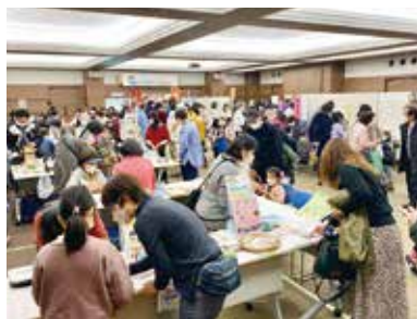
練馬つながるフェスタ 地域で活動する30以上の団体が集まり、ワークショップや物販、体験コーナー、パネル展示などを行い、多くの来場者で賑わいました。(3月4日 ココネリ)