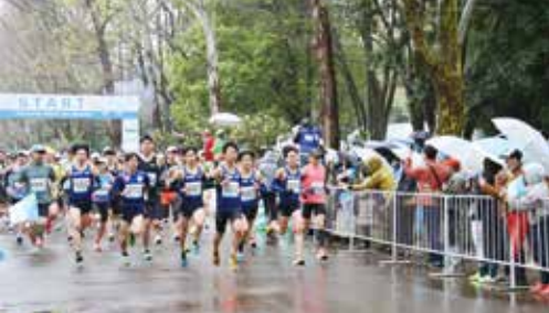
練馬こぶしハーフマラソン 4年ぶりの開催。雨にも負けず、約5,000人のランナーが桜とコブシに彩られたコースを走り抜けました。(3月26日 光が丘公園とその周辺)