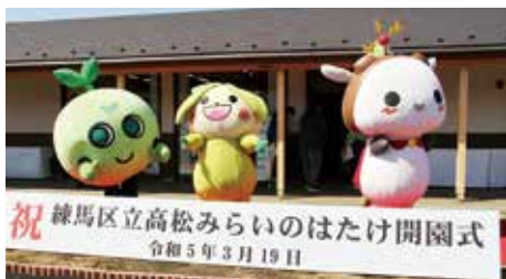
区民が気軽に農業体験できる「練馬区立高松みらいのはたけ」がオープン。開園式には地域の児童ら約120人が参加し、ジャガイモの種子植付け体験を行いました。(3月19日 高松)