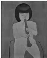
《笛を吹く童女》1978年 油彩、カンヴァス 個人蔵

4月29日(土祝)～6月18日(日) 練馬区立美術館(貫井1) 一般 1,000円 他 戦前・戦後を通して 独自のスタイルで絵画や 壁画などを描いた美術家・大 沢昌助。モダンでシンプル、自 由で軽やかさが息づく作品約 120点を展示し、大沢芸術の 豊かさと多面性を紹介する。