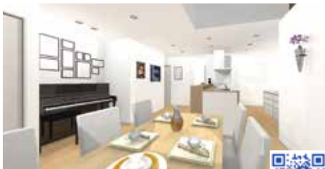
VR「二世帯クエスト」のバーチャル空間

ラブルの原因になりそうなポイントを「ぐすん」と命名。間取りの変更で解決できる構造上の「ぐすん」や、家族間のルールづ