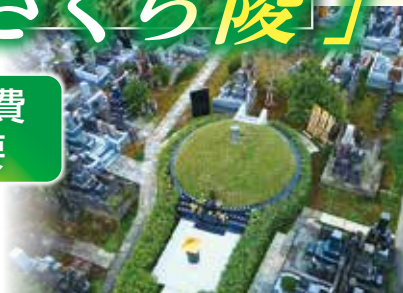
前方後円墳をイメージした「さくら陵」