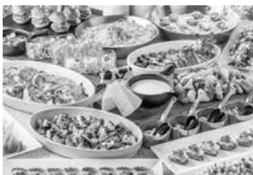
*ホテルカデンツァ東京公式インスタグラムでは最新情報を配信しております。