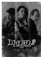
「コンフィデンスマンJP 英雄編」1月14日公開 ©2022「コンフィデンスマンJP」製作委員会

シリーズ3作目は地中海に浮かぶ世界遺産・マルタ島が舞台。元マフィアが所有する幻の古代ギリシャ彫刻(踊るビーナス)を狙う3人に、警察やインターポールの捜査の手が迫る…。果たして最後に笑うのは誰なのか!? ※1月公開予定作品はP.31参照