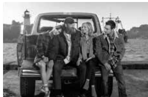
「Coda コーダ あいのうた」1月21日公開

家族の中で唯一の健聴者であるルビーは、高校で合唱部に入ると歌の才能を見出され音楽大学の受験を勧められる。が、歌が聞けない両親は大反対。ルビーは夢を諦め家族を支え続けることを選ぶが、ある時、父がその才能に気づき…。PG12 指定作品