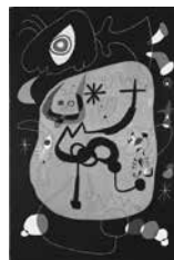
ジュアン・ミロ (ゴシック聖堂でオルガン演奏を聞いている踊り子) 1945年 油彩、キャンバス 福岡市美術館 E4304

ミロと日本の深いつながりを紐解く世界初の大規模展。代表作のほか、日本への憧れを象徴する初期作品や日本で初めて展示した作品など、スペイン、ニューヨーク、日本各地から集めた約130点の作品と資料を展示。2月11日~4月17日 一般 1,800円 他