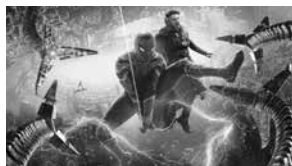
「スパイダーマン：ノー・ウェイ・ホーム」1月7日公開

スパイダーマンであることが世界中に知られてしまったピーターは、人々からその記憶を消すためドクター・ストレンジに呪文を唱えてもらうが、時空が歪み、マルチバース=多元宇宙が出現。それぞれの宇宙から過去の敵を呼び寄せてしまう。