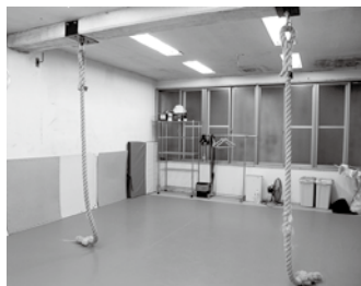
道場には天井から垂れ下がった2本の太いロープが。腕だけを使って登ることで、楽しみながら自然と背筋が鍛えられます

です。ちゃんとあいさつをしてけじめをつけた上で、思い切りケンカしたり、泣いたり、笑ったりする場所は、最近少ないですからね。ここで